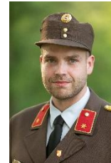
BI Bernhard Oegger Lotsen- und Nachrichtendienst